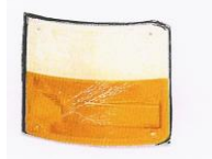
VOLVO F12 -400 725. Φλας (L) 724 Φλάς(R)