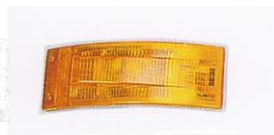
726 Φλας Κίτρινο (L-R)