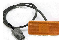
495 Με Καλώδιο LED