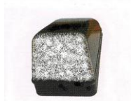
Φανός Κουβουκλίου 577. Κομπλέ Βάση για Κινέζο 579. Πλαστ. Λευκό FH 1-2 580. Πλαστ. Κίτρινο FH