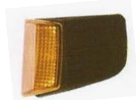
521. (R.) VOLVO FM Κινέζος