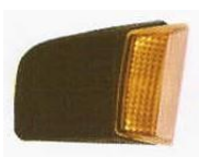
520. (L) VOLVO FM Κινέζος